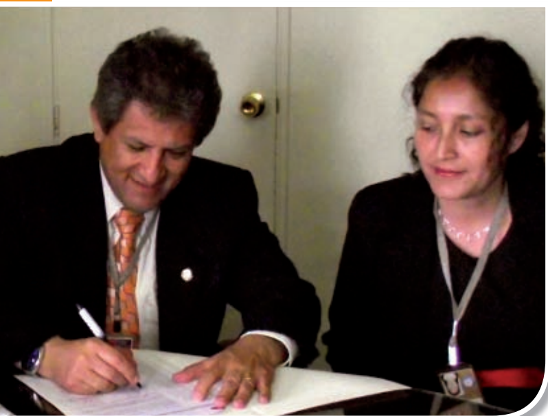
Firma de convenio entre el CMP y Hospital San Juan de Lurigancho.