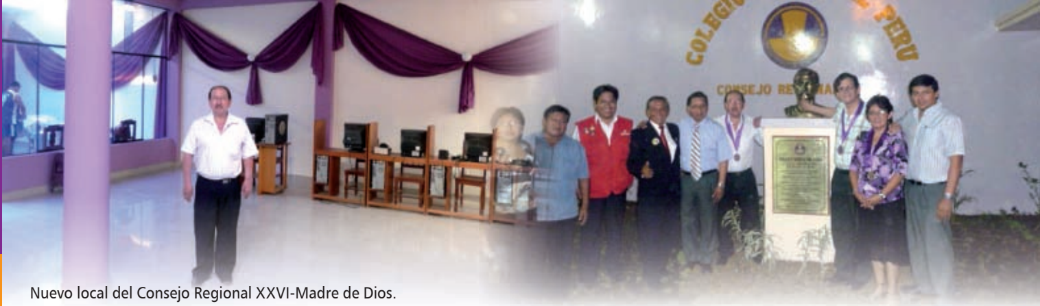
Nuevo local del Consejo Regional XXVI-Madre de Dios.

la adquisición de nuevo hosting, software. Se modernizó la página web del Colegio, así como el servicio de internet inalámbrico con cobertura para todo el local central CMP y con acceso libre a todos los colegiados. También se buscó generar una nueva imagen institucional por lo que se reorganizó la Unidad de Comunicaciones e Información y se fortaleció el logo institucional.