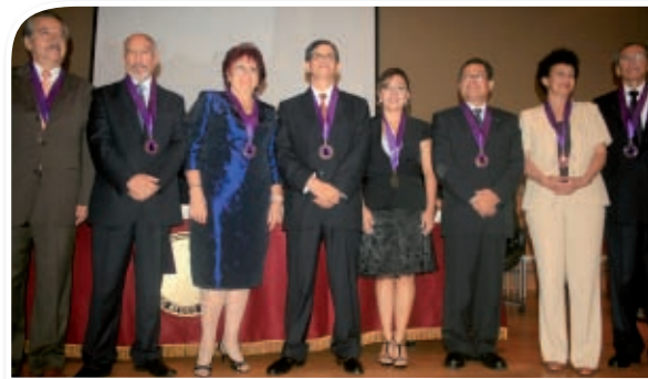
Autoridades del CMP.

Hemos trabajado conjuntamente con varios Consejos Regionales el abordaje de temas pertinentes a la agenda médico sanitaria nacional y regional. Asimismo, una comisión de expertos realizó el análisis de la Ley de Aseguramiento Universal en Salud (AUS) documento que fuera difundido en