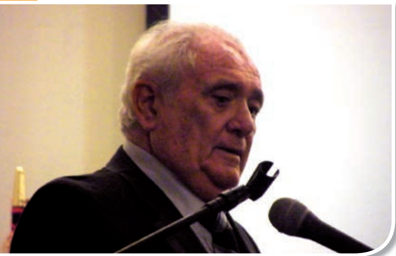
Dr. Carlos Bazán Zender (Ex Ministro de Salud)