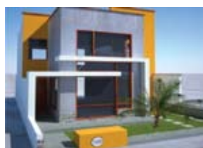
¡GRATIS! Plano 3 pisos

¡Invierte en el futuro y la calidad de vida de tu familia!