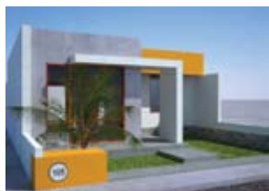
¡GRATIS! Plano 1 piso

Visita nuestra Oficina Comercial en Av. Balta 665 Ofc. 403 Chiclayo, y elige tu Lote