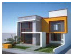
¡GRATIS! Plano 2 pisos